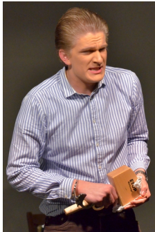
Harmloser Bürger oder Wolf?

Beginn mit Demokratie und sozialem Rechtsstaat. Das ging los mit John Locke und Montesquieu, z. B. wurden die unterschiedlichen Aspekte der Demokratie betrachtet und die für uns „zuständigen“ Elemente: Bundestag, Bundesrat, Bundesverfassungsgericht, Regierung, Opposition. „Das Machtgefüge der Verfassungsorgane im politischen Entscheidungsprozess im Bezug auf die zukünftige demokratische Entwicklung.“ - Welch hehre Worte!! - In der Frühzeit der Bundesrepublik Deutschland gab es einen Innenminister, der nach Verfehlungen sagte, er könne nicht immer mit dem Grundgesetz unter dem Arm rumlaufen. # Und dann wurde es Nacht. Alle schliefen ein und nur die Werwölfe erwachten und suchten blutrünstig ihr Opfer unter den braven Bürgern. Nur das Luschemädchen verfolgte heimlich (ängstlich) diese Aktivitäten. Danach war es die Hexe, die sich den Wölfen anschließen, das Opfer diesmal retten konnte oder selbst blutrünstig wie ein Wolf sein konnte, wenn auch nur einmal. Selbst für eine Hexe eine schwere Entscheidung! # In China gab es in der Nach-Mao-Tse-Tung-Ära die Viererbande (So hießen sie erst, als sie vor Gericht gestellt wurden.) und wir erlebten die Wiederkehr dieser Gruppe – eigentlich unglaublich – sodass sie immer mal wieder aus dem Verkehr gezogen werden musste, d. h. sie wurde in die Bibliothek verbannt. Tim, nein Martin, nein Daniel – Wie jetzt??? - betrachtete diesen Vorgang souverän und machte sich dann aber ernsthafte Gedanken über die Rolle des Staates in der soziale